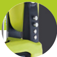
variable Drehzahl (5 - 80 U/min) & wechselnde Drehrichtung