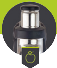
Einfüllschacht ø 79 mm