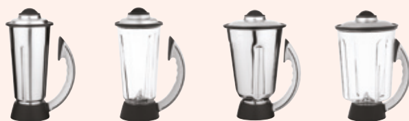
2 I 2 P 4 I 4 P Aufsatz auswählen